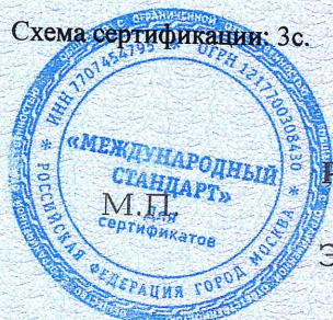
Схема сертификации: 3с.